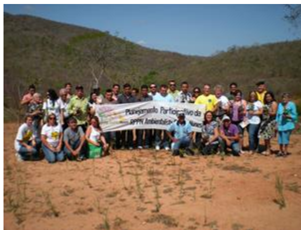
Fig. 4 - Programa de Educação Ambiental (Escola Natureza)

RPPN Ambientalista Francy Nunes (CE) – “... eleita como RPPN piloto para um Plano de Manejo ...” devido ao grande interesse do proprietário e aos trabalhos de educação ambiental e desenvolvimento local sustentado desenvolvido pela RPPN em seu entorno.” Programa de Educação Ambiental (Escola Natureza) , onde disponibilizamos nossa área como laboratório vivo, para aulas de campo para escolas” ...do entorno ....” “Nosso próximo desafio é envolver cada vez mais a comunidade nessa nova forma em olhar nossa “Mata Branca”