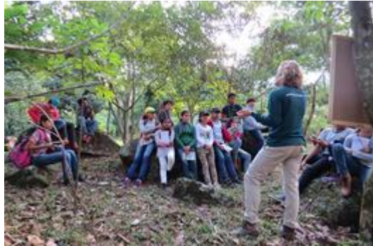
Fig. 7 - Visitação Escolar na RPPN Iracambi

RPPN Iracambi (MG) – O Centro de Pesquisas Iracambi criou no ano 2000 o primeiro projeto de educação ambiental no município de Rosário da Limeira, antes mesmo da inclusão do tema no currículo estadual. O programa contemplou mais de 1000 estudantes das escolas da rede escolar municipal e estadual, que, pontualmente faziam visitas a trilhas da RPPN.