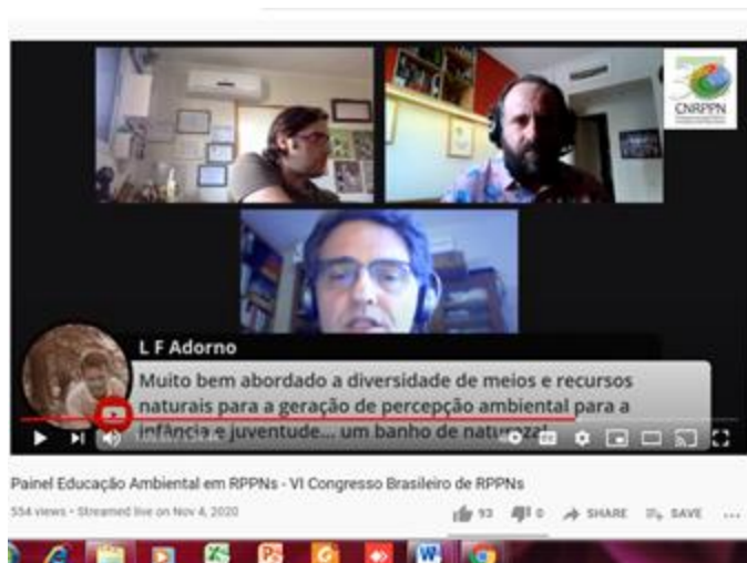
Fig. 2 - Videoconferência VI Congresso Brasileiro das RPPNs

No VI Congresso Brasileiro das RPPNs - 2020 foi realizado um Painel de Educação Ambiental de RPPNs no qual foram apresentados em forma de vídeos e fotos estudos de casos de várias RPPNs. Os organizadores do Painel foram professores da UNICAMP e um representante do SESC SP. O Painel pode ser novamente assistido via Youtube no link: https://www.youtube.com/watch?v=Vc-QKCSUDaA . As RPPNs convidadas para o Painel foram: Airumã (PR); Agulhas Negras (RJ); Bosque de Canela (RS); Caetezal (SC); Cristalino (MT); Duas Cachoeiras (SP); Fazenda Bulcão (MG); Fazenda Lagoa (MG); Fazenda Morro de Sapucaia (RS); São Judas Tadeu (SP), Serra do Pitoco (SC); Reluz (ES); - Reserva Natural Pedra D'Anta (PE).