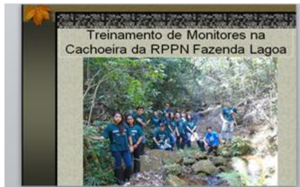
Fig. 6 - Treinamento de Monitores RPPN Fazenda Lagoa

RPPN Fazenda Lagoa (MG) – O Programa de Educação Ambiental nas florestas da atual RPPN iniciou com a fundação do ISMECN, já tendo envolvido mais de quatro mil estudantes e professores e contemplado instituições de ensino em um raio de 200 km, no sul de Minas Gerais.