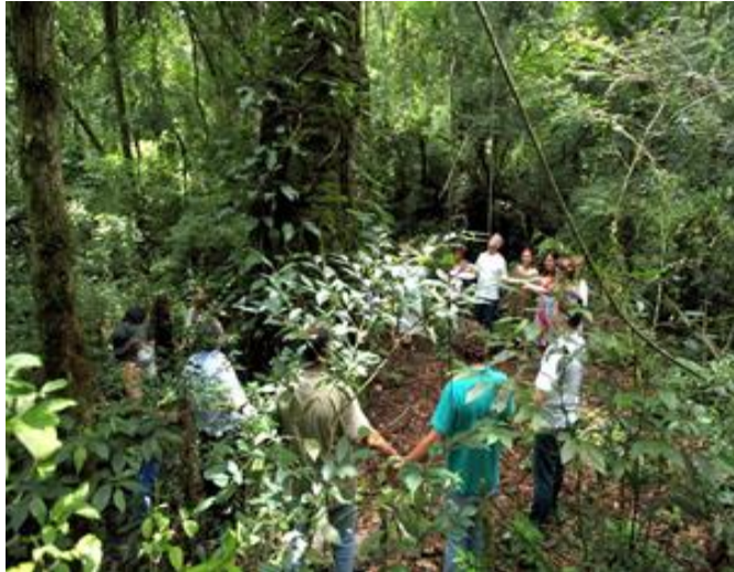
Fig. 3 Integrantes da APAVE em torno da Vovó Airumã

RPPN Alto da Boa Vista (MG) – “... é reconhecida pelo seu pioneirismo na região, notoriamente no estabelecimento da atividade do turismo ecológico aliado à educação ambiental.”