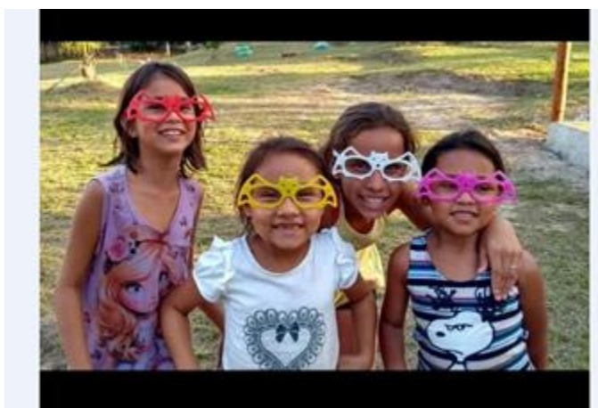
Fig. 9 - Crianças da Comunidade São João do Tupé posam com seus óculos morcegos

Através de contatos com proprietários (as) e gestores de RPPNs foram obtidas informações sobre atuação com educação ambiental como da RPPN Sítio Bons Amigos em Manaus (AM), Nesta RPPN de Manaus são desenvolvidas atividades de Educação Ambiental desde sua implantação com ênfase na Conservação de morcegos tendo chegado a realizar um Festival dos Morcegos na Reserva. Em função deste projeto foi outorgada como Área de Interesse para Conservação de Morcegos pela Rede Latino-americana e Caribe para a Conservação de Morcegos.