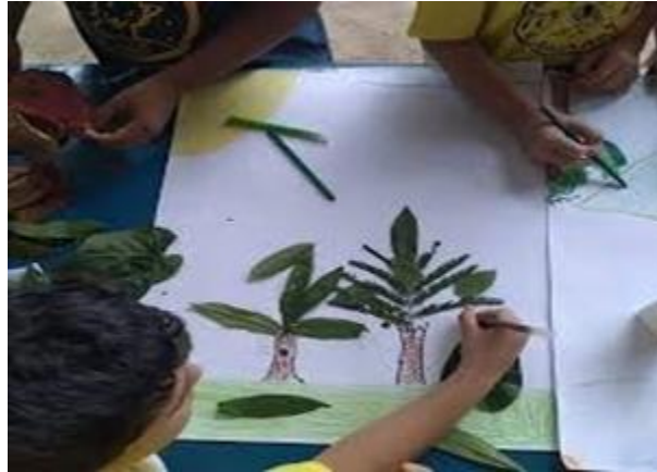
Fig. 5 - Lobinhos em visita a RPPN Campo Escoteiro elaborando arte com folhas

RPPN Campo Escoteiro Geraldo Nunes (RJ) – “.... a gestão da área e a Região Escoteira do Rio de Janeiro, buscam implementar nos jovens escoteiros, assim como na comunidade, uma consciência do dever e da responsabilidade de cuidar desse patrimônio que, afinal de contas, eles terão por herança.