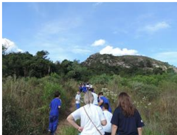
Fig. 8 - Projeto Conhecer - RPPN Morro Sapucaia